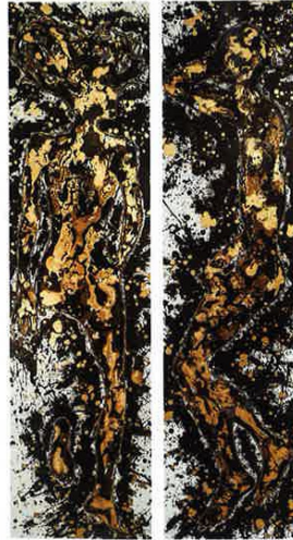
« Marble water », « Khéops », « Perspectives sur Placoplâtre », « Silverwing »... autant de noms qui donnent le la de ce show inédit et innovant.