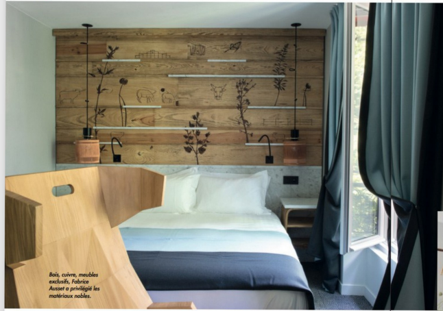
Bois, cuivre, meubles exclusifs. Fabrice Ausset a privilégié les matériaux nobles.