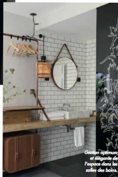
Gestion optimum et élégance de l'espace dans les salles des bains.