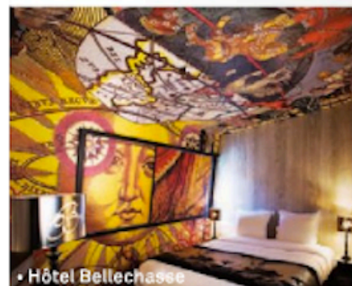
• Hôtel Bellechasse

34 chambres. Tarifs : 340 et 390 euros. Petit déjeuner : 21 euros.