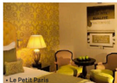
• Le Petit Paris

20 chambres. Tarifs : 240 à 360 euros. Petit déjeuner : 12 euros